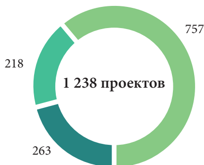
Распределение проектов в НИП по сферам